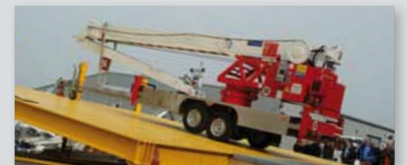
... CLEVER & FLEXIBEL!