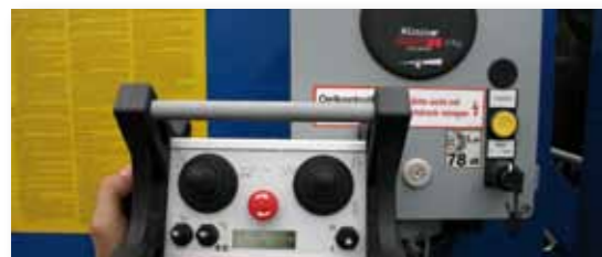
... INTELLIGENT & INNOVATIV!